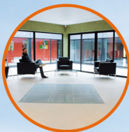
UNE SALLE D'ACCUEIL

Cette structure de plus de 700m 2 a été conçue et bâtie pour permettre la conduite de l'ensemble des études nécessaires à la démonstration des allégations de santé dans tous les domaines où les ingrédients, les compléments alimentaires et les aliments fonctionnels peuvent apporter un bénéfice pour la santé humaine et sa préservation.