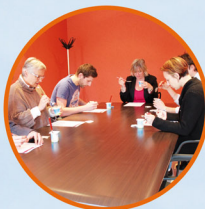
UNE SALLE DE PRISE DE REPAS DÉDIÉE SPÉCIFIQUEMENT AUX ÉTUDES SENSORIELLES, DE SATIÉTÉ ET DE RASSASIEMENT