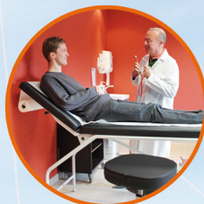
DES SALLES D'EXAMEN CLINIQUE